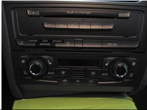
Klimabedienteil ausbauen remove the climate control